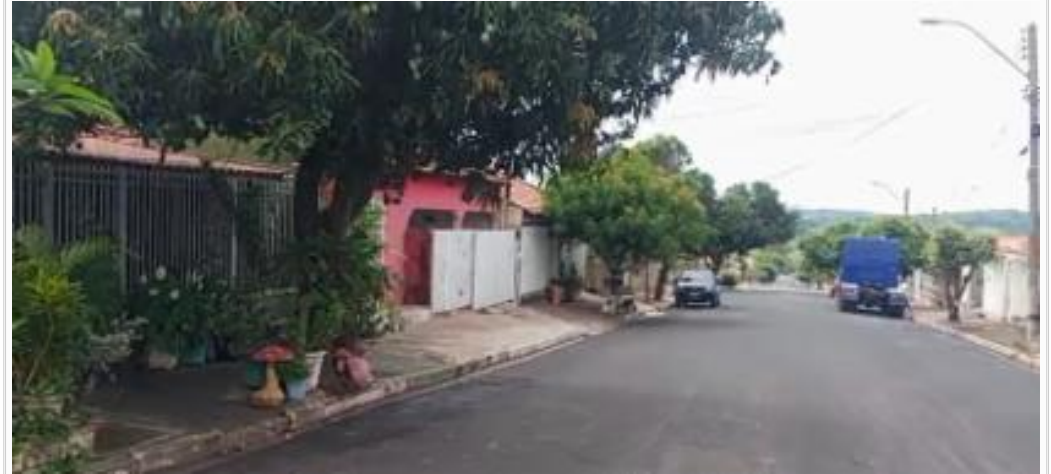
vista parcial da rua