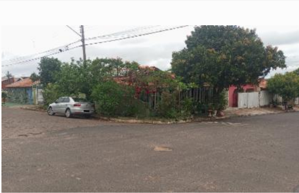
vista parcial da fachada