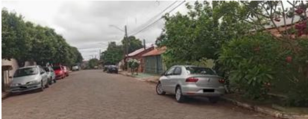
vista parcial da rua