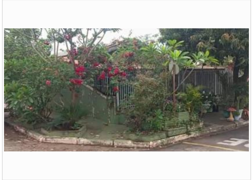
vista parcial da fachada