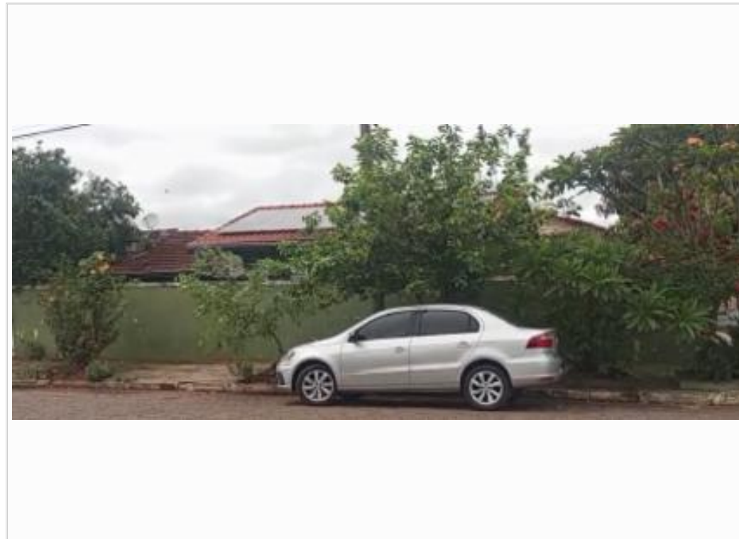
vista parcial da fachada