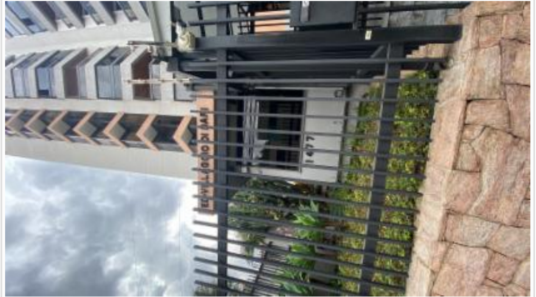
Identificação e expressão numérica