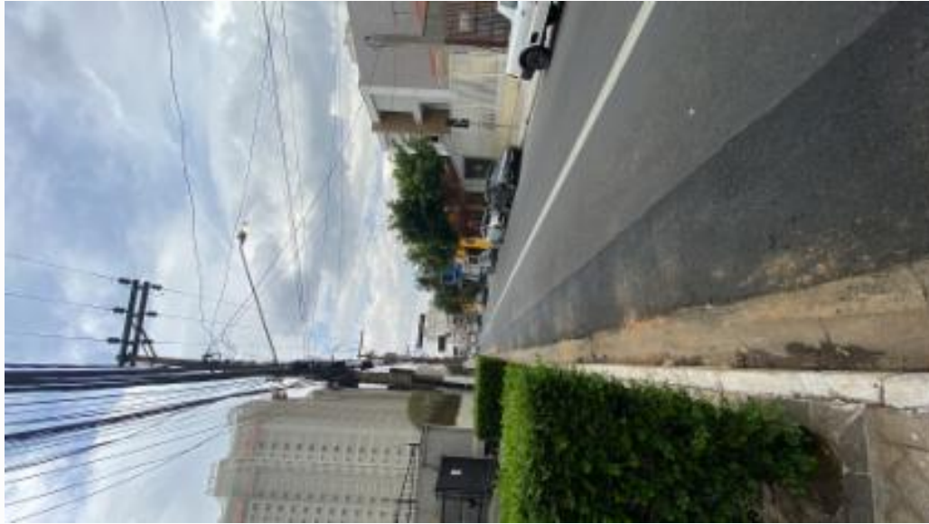
Rua lado esquerdo