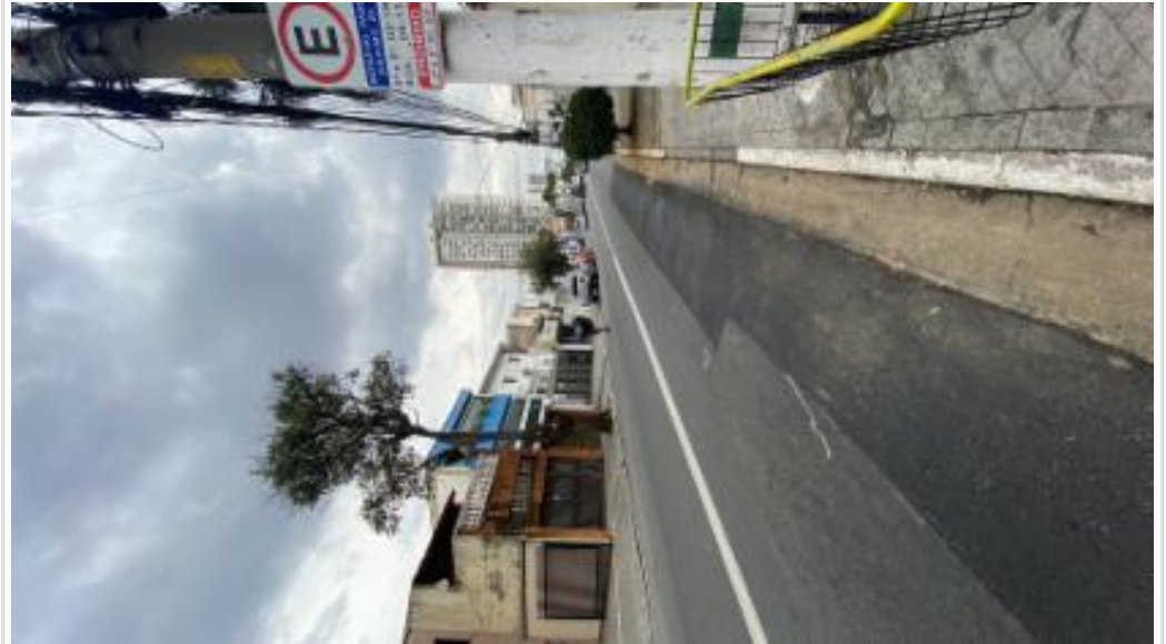
Rua lado direito