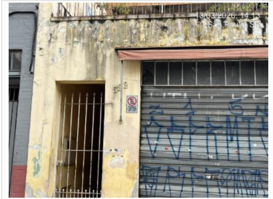
id vizinho esq