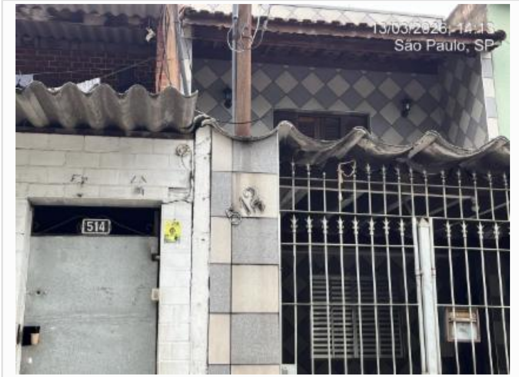
id vizinho dir