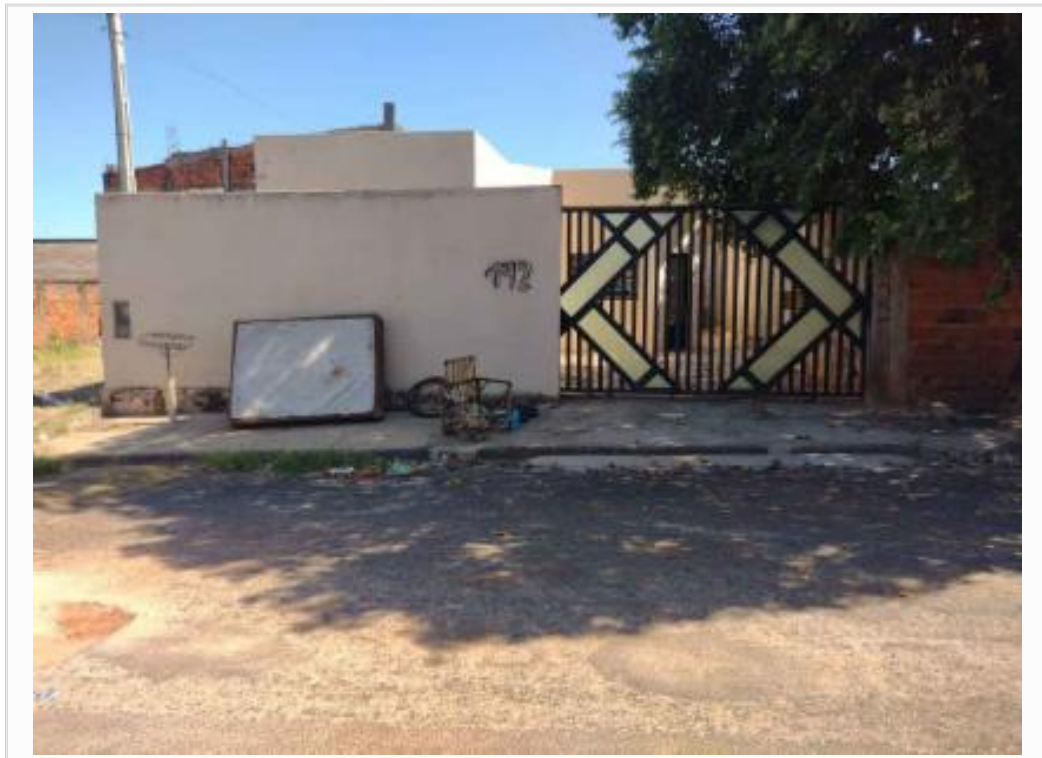
Fachada do avaliando