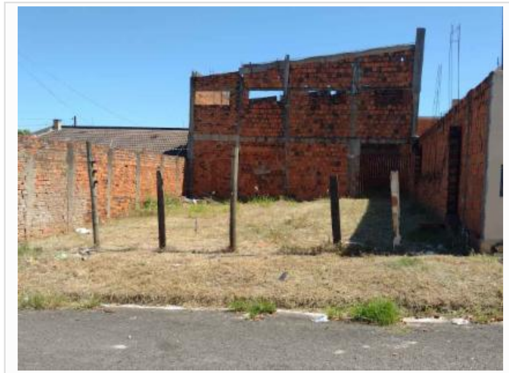
Vizinho à esquerda sem identificação