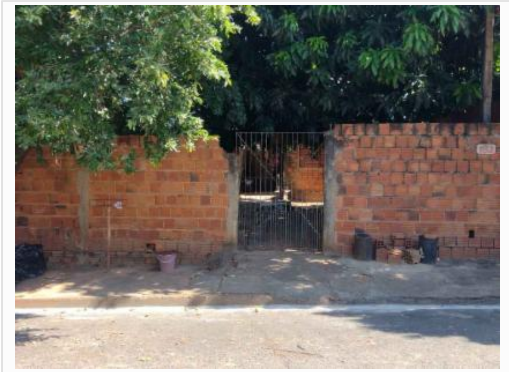
Vizinho à direita