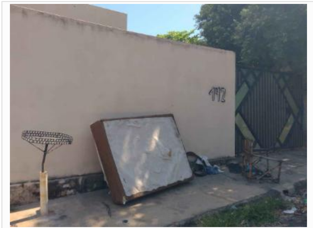
Fachada do avaliando