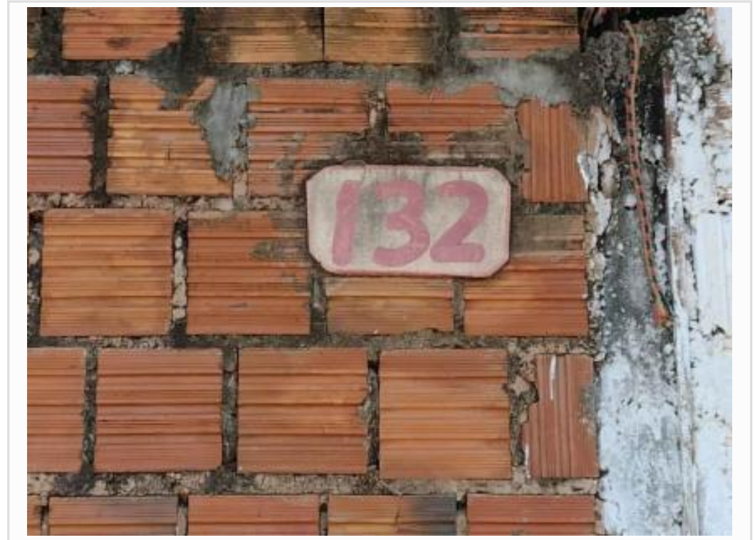
Vizinho à direita identificação