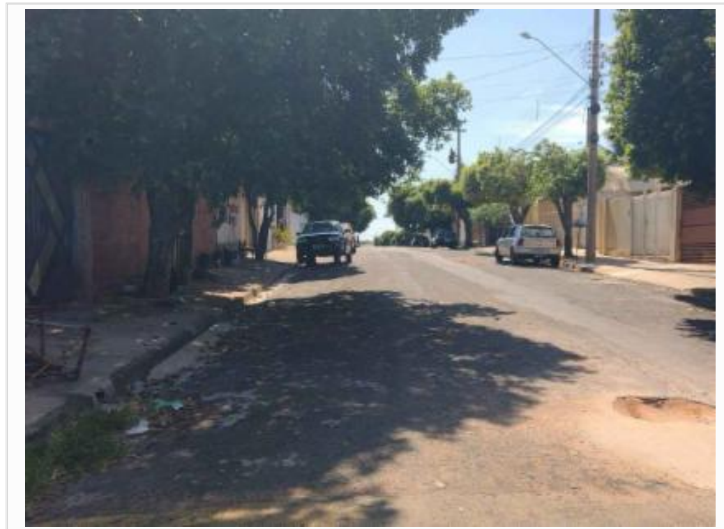
Vista do logradouro