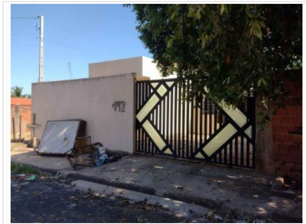
Fachada do avaliando