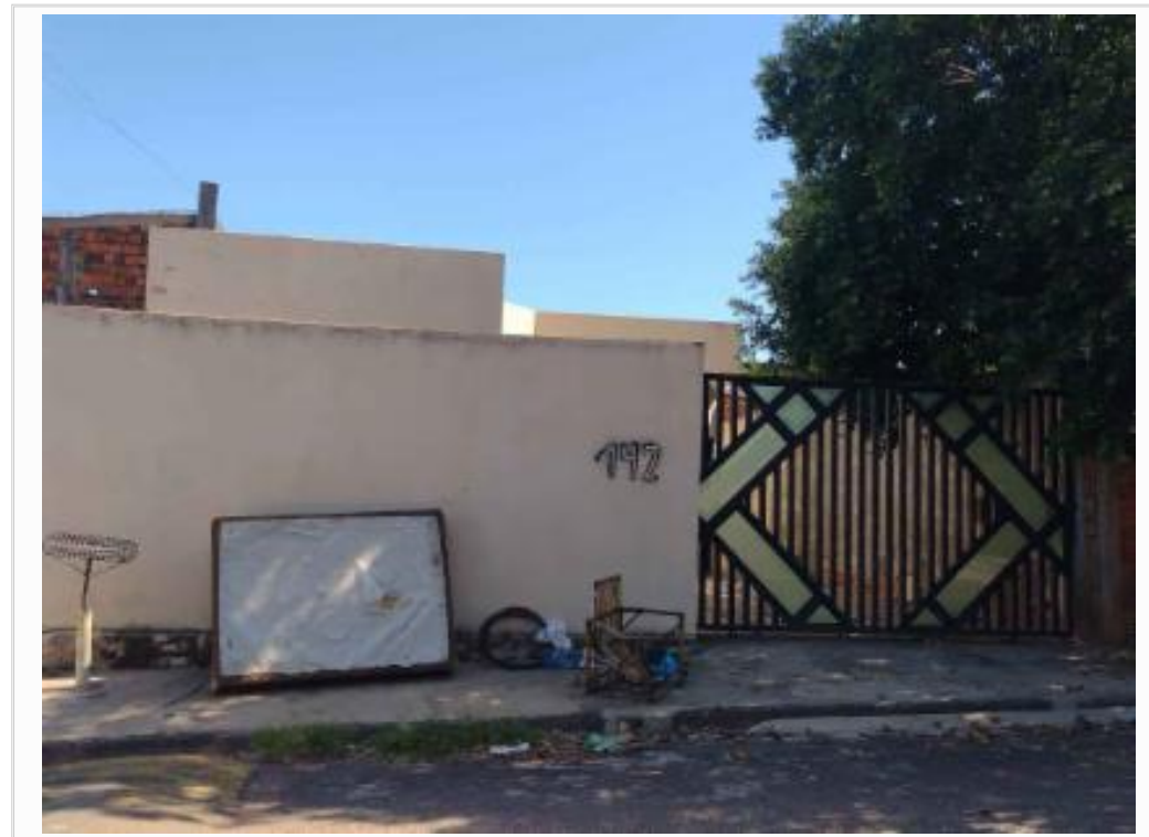
Fachada do avaliando