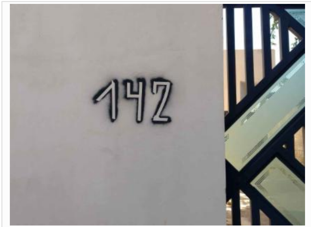
Identificação do avaliando