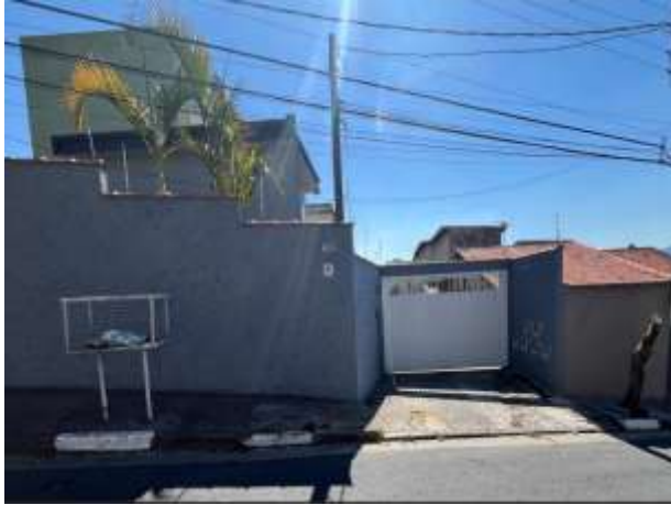
Vista parcial do condomínio