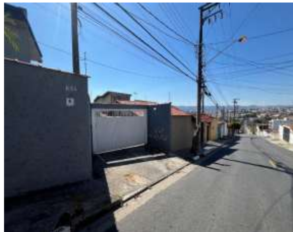
Vista parcial do logradouro