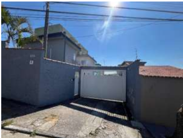
Vista parcial do condomínio