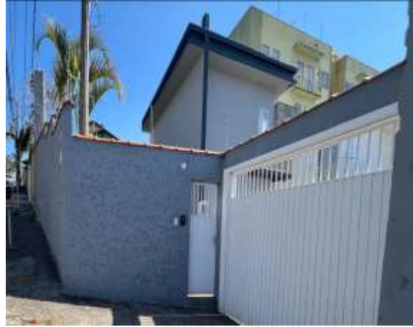
Vista parcial do condomínio