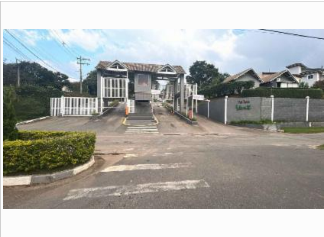
Vista externa da portaria PAYSAGE VERT