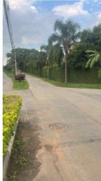
via lado esquerdo externo