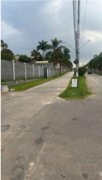
Via lado direito externo