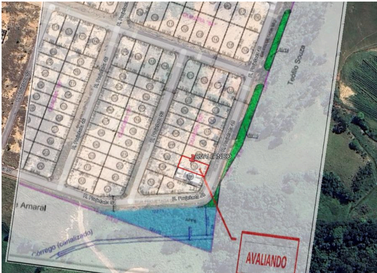
Representação: Planta de Quadra