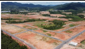
Representação Fachada Principal Descrição Data Foto 23/01/2026