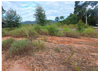
Representação Terreno sem Benfeitorias Descrição Data Foto 23/01/2026