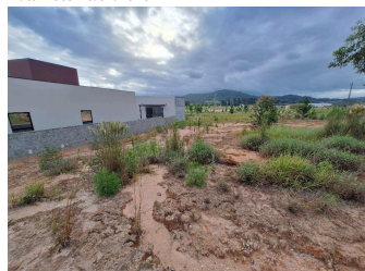
Representação Terreno sem Benfeitorias Descrição Data Foto 23/01/2026