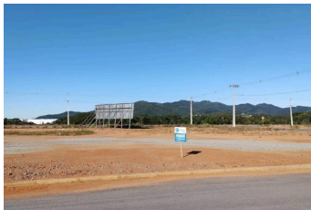
Representação Fachada Principal Descrição Data Foto 23/01/2026