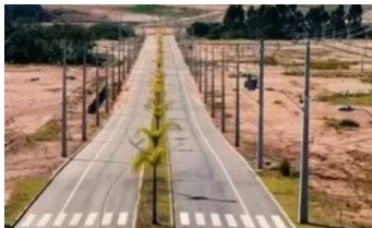
Representação Fachada Principal Descrição Data Foto 23/01/2026