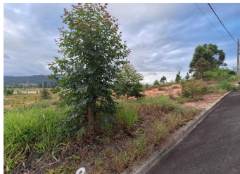
Representação Vista da Rua Descrição VIZINHO Data Foto 23/01/2026