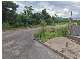
Representação Vista da Rua Descrição Data Foto 23/01/2026