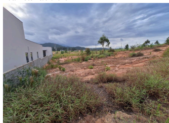
Representação Terreno sem Benfeitorias Descrição Data Foto 23/01/2026