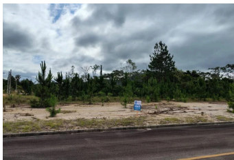
Representação Fachada Principal Descrição Data Foto 23/01/2026