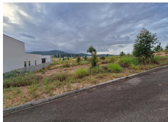
Representação Fachada Principal Descrição Data Foto 23/01/2026