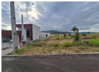
Representação Fachada Principal Descrição Data Foto 23/01/2026