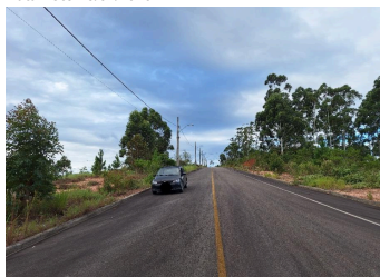
Representação Vista da Rua Descrição Data Foto 23/01/2026