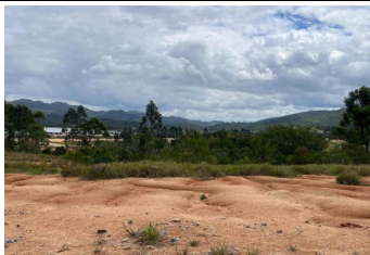
Representação Fachada Principal Descrição Data Foto 23/01/2026