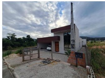
Representação Vista da Rua Descrição VIZINHO Data Foto 23/01/2026