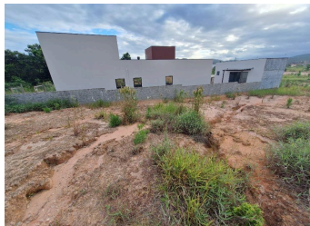
Representação Terreno sem Benfeitorias Descrição Data Foto 23/01/2026