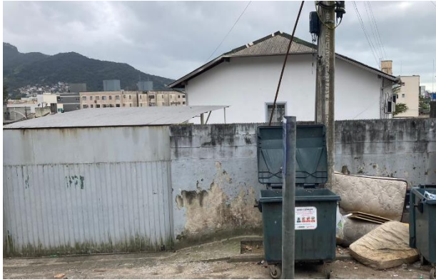
Vista parcial do condomínio