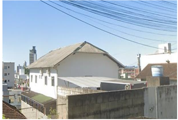
Vista parcial do condomínio