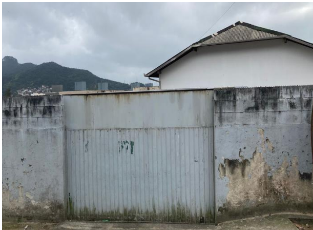
Vista parcial do condomínio