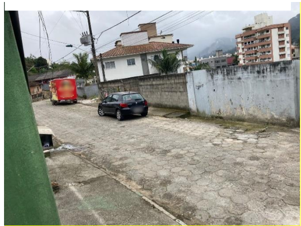
Vista parcial do logradouro