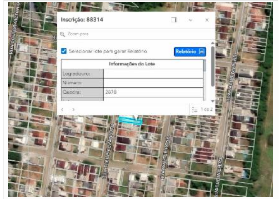
Mapa de Loteamento