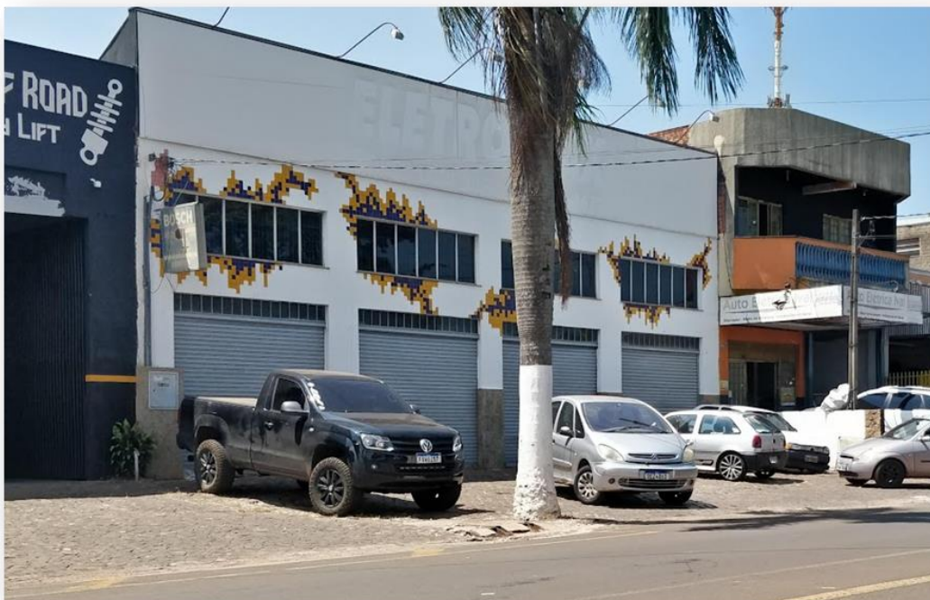
Imagem janeiro 2025