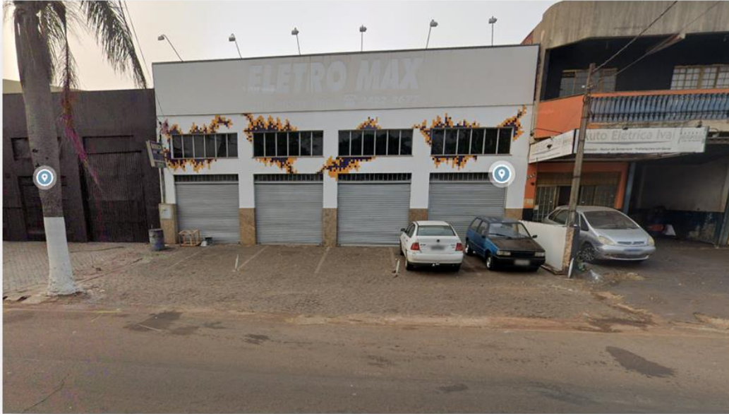
Imagem setembro 2024