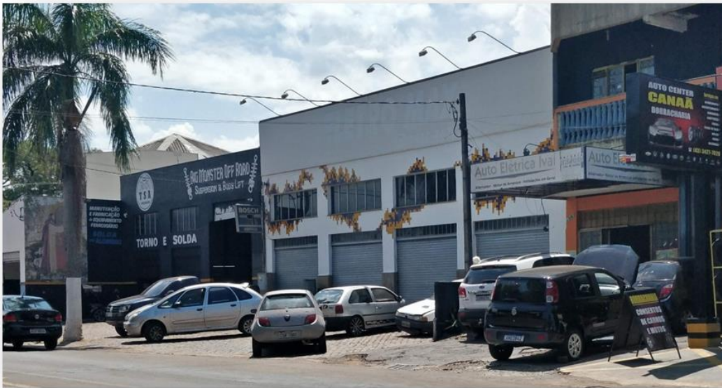
Imagem janeiro de 2025

Documento assinado digitalmente, conforme MP nº 2.200-2/2001, Lei nº 11.419/2006, resolução do Projudi, do TJPR/OE Validação deste em https://projudi.tjpr.jus.br/projudi/ - Identificador: P-J8KM CNRMB 87VU2 GZARY