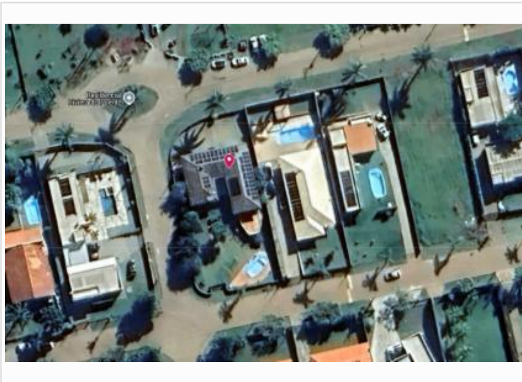
Croqui do avaliando