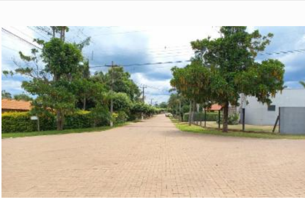
Vista da rua