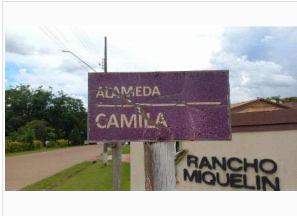
Identificação do logradouro - Fundos