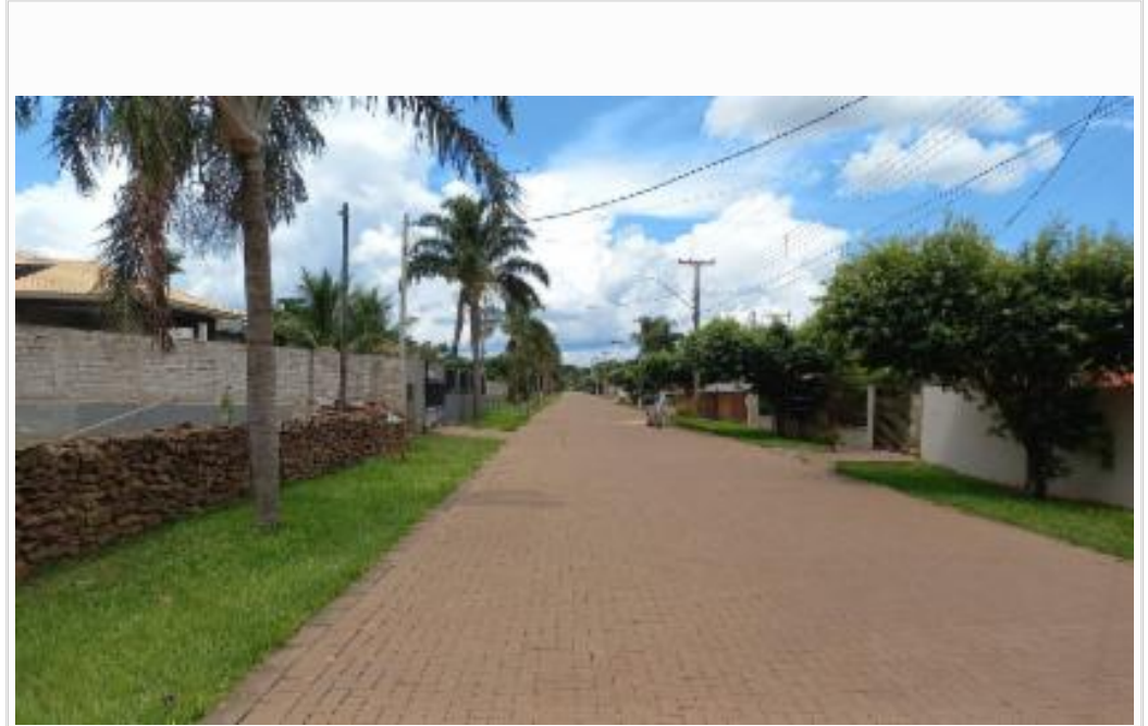
Vista da rua