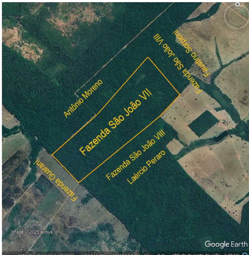
Figura 2 – Limites e Confrontantes Fazenda São João VII

Avenida General Osório, nº 363, Bairro Centro, Brasnorte – MT CEP: 78.350-00 FONE: 66 3592- 2287/ 3592-2243