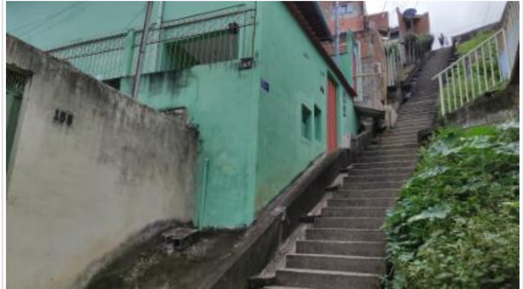
Vizinho lateral direito