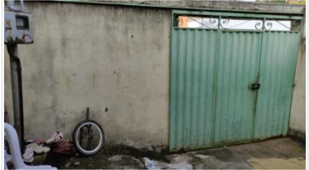
Portão de acesso