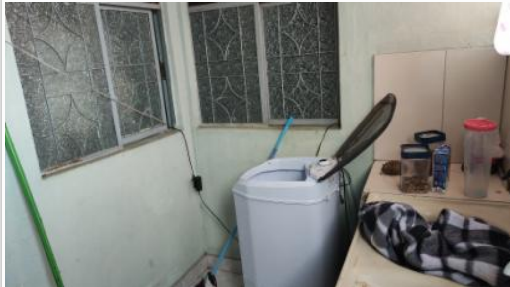
Área de serviço