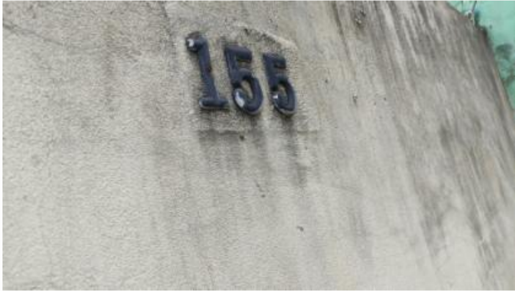
Identificação do avaliando