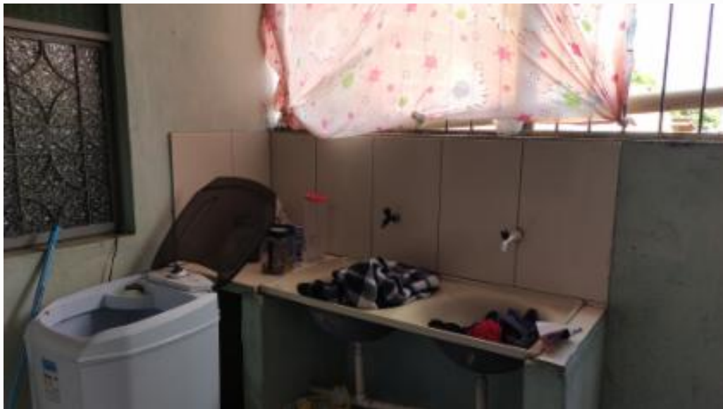
Área de serviço