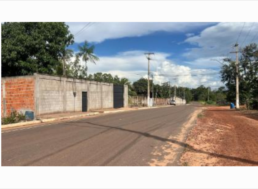
vista da rua