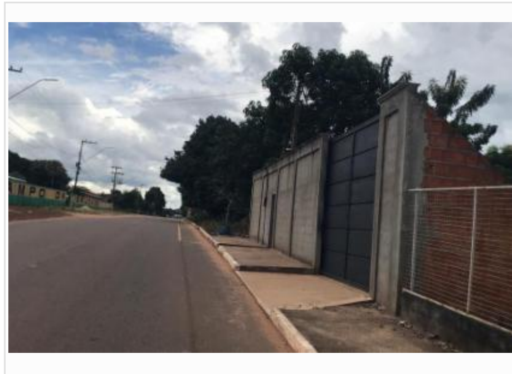
vista da rua