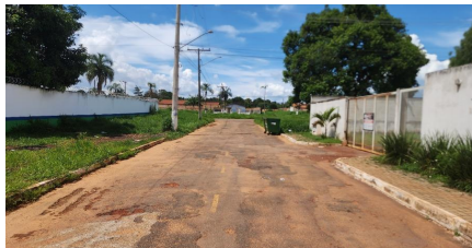
Representação Vista da Rua Descrição Data Foto 09/12/2024