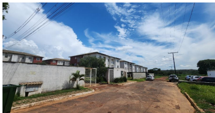
Representação Fachada Principal Descrição Data Foto 09/12/2024