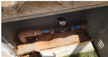
Representação Identificação Numérica Descrição Cavalete Data Foto 09/12/2024