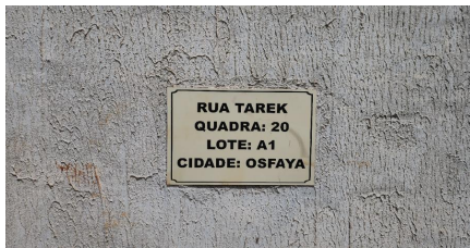
Representação Identificação Numérica Descrição Data Foto 09/12/2024