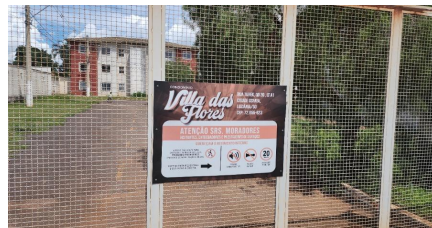
Representação Identificação Numérica Descrição Data Foto 09/12/2024