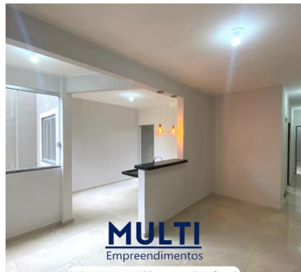
Representação Fachada Principal Descrição Data Foto