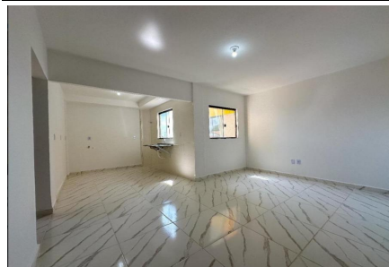
Representação Fachada Principal Descrição Data Foto