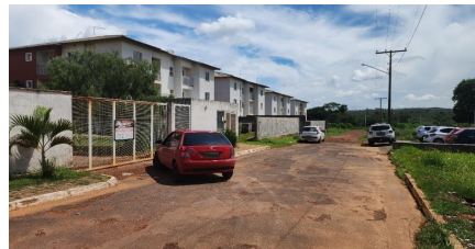
Representação Vista da Rua Descrição Data Foto 09/12/2024