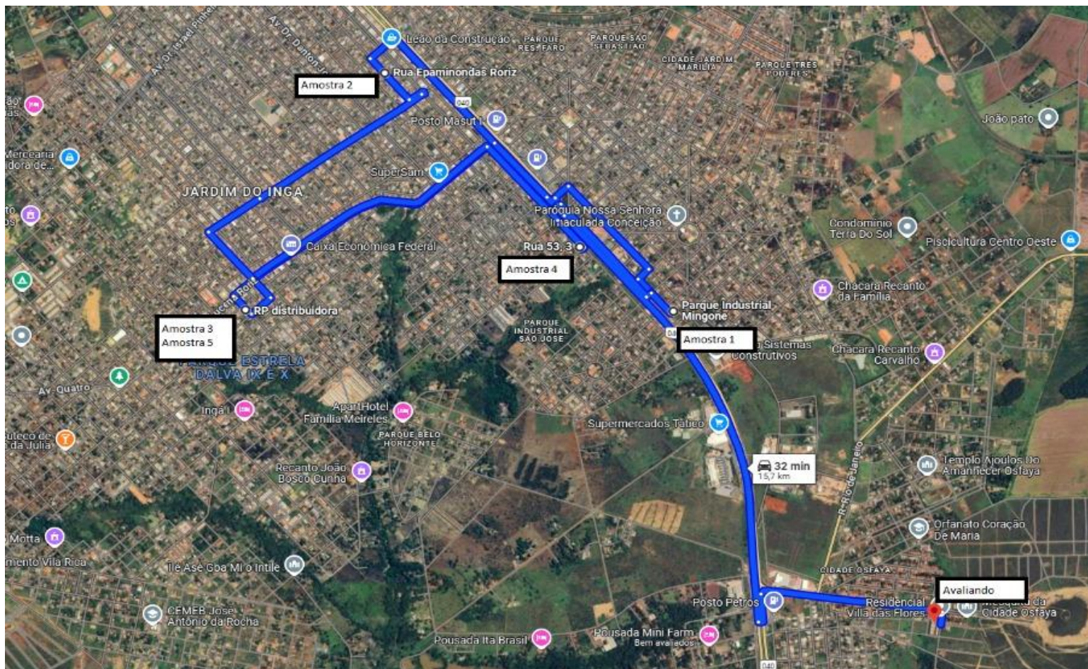
Representação: Planta de Quadra