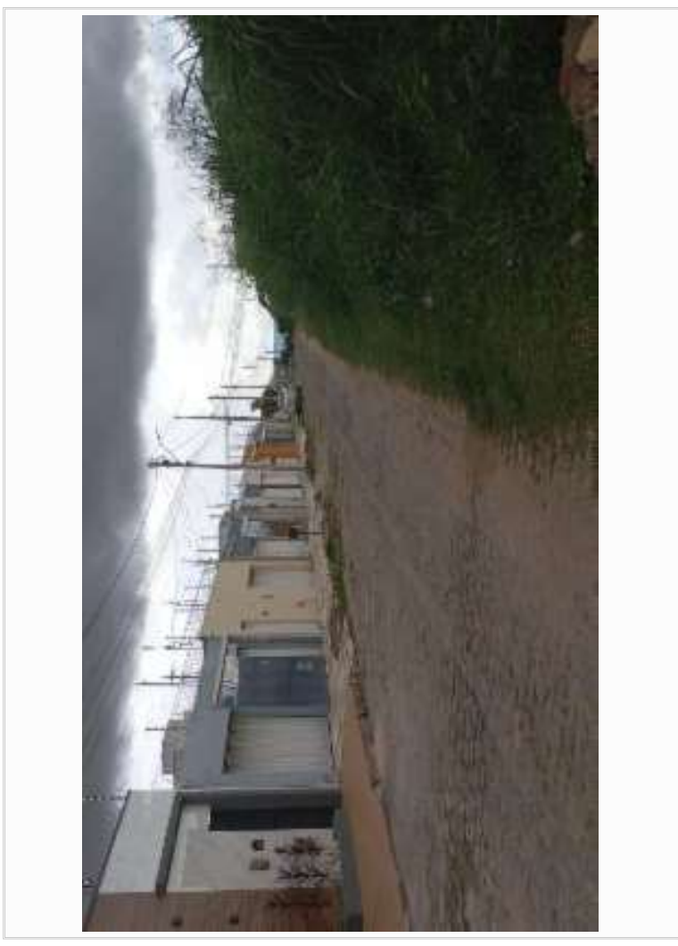
Logradouro/vizinho lado esquerdo