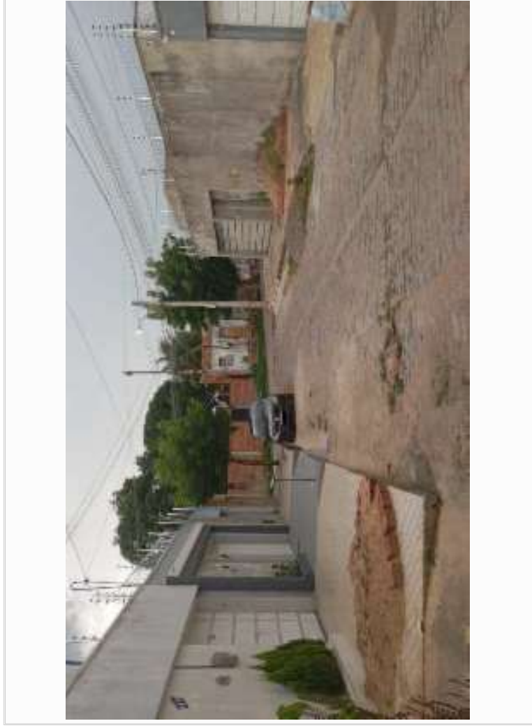
Logradouro/vizinho lado direito